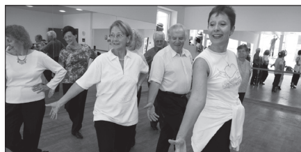
Rapporto di gestione 2008 / 2009